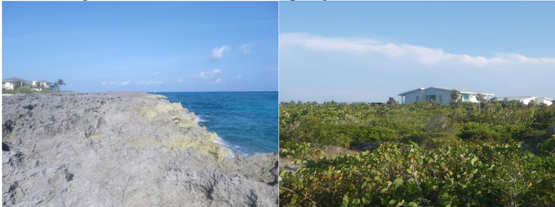
Figura 6 - Imágenes que recibieron una diferencia de valoración de -0,47 (izquierda) y -0,44 (derecha) respecto a las mismas unidades de paisaje sin construcciones hoteleras