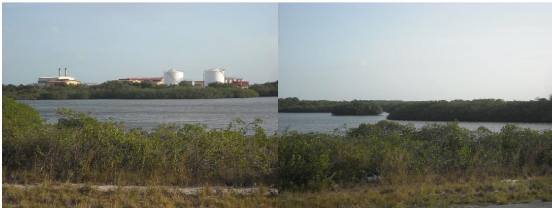
Figura 5- Izquierda: Base logística en Cayo Santa María. Derecha: zona de manglares cercana a la anterior

Sin embargo, la diferencia máxima (-1,61 puntos), como era de esperar la presenta el par correspondiente a la unidad donde se construyó la base logística (P19 y P20), una especie de polígono industrial que albergaba principalmente almacenes y talleres cuyo fin era abastecer de materiales a la construcción, así como la central de generación eléctrica y los bloques residenciales donde se alojaban los obreros y albañiles durante el tiempo que permanecían en el cayo. Estas construcciones se realizaron sobre una unidad de manglares en el borde suroriental del cayo (Figura 5).