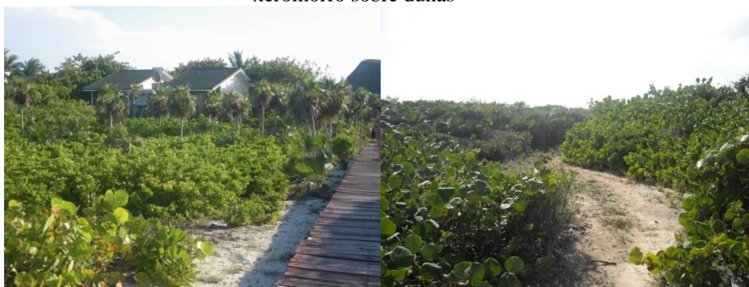
Figura 3 - Izquierda: bungalows del Hotel Sol Santa María. Derecha: uveral y matorral xeromorfo sobre dunas

Respecto a las “anomalías detectadas”, cabe mencionar en primer lugar un caso en que la valoración es ligeramente mayor para la unidad con construcciones hoteleras: el correspondiente a la imagen P11 respecto a la P12 (+0,12 puntos). En este caso se trata de una unidad de uveral sobre dunas bajas cercana a la playa, con matorral xeromorfo al fondo (Figura 3). Los bungalows que se observan en la imagen de la izquierda corresponden al Hotel Sol Santamaría. Se trata del primer hotel que se construyó en el cayó, con una intención clara de integración paisajística: materiales livianos (madera predominantemente), colores poco contrastados con la vegetación, altura baja de las construcciones, baja densidad edificatoria y gran espaciamiento entre los módulos habitacionales, etc.