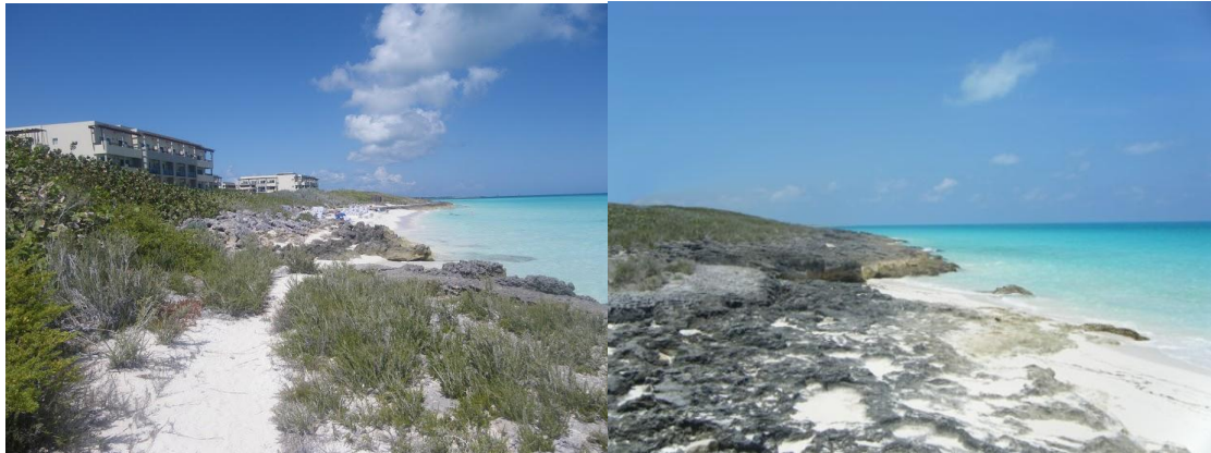
Figura 4 - Izquierda: Hotel Eurostars Cayo Santa María. Derecha: zona cercana a la anterior sin construcciones hoteleras